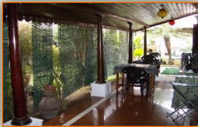
Spencer home, Cochin