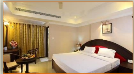
Sea Pearl Kollam