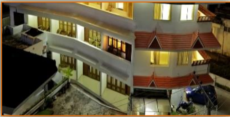
Swapnatheeram resort Kovalam

Voici les hôtels ou équivalents dans lesquels nous descendrons :