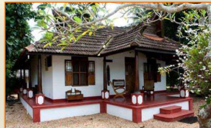
back water farm House, Allepey

L'hébergement est en chambres doubles en lit twin ou kingsize suivant les possibilités de l'hôtel. Même de bonne catégorie, le standard des hôtels indiens ne correspond pas toujours au standard des hôtels occidentaux. Des petites imperfections subsistent.